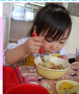
うめぐみさんの おいしい顔♡