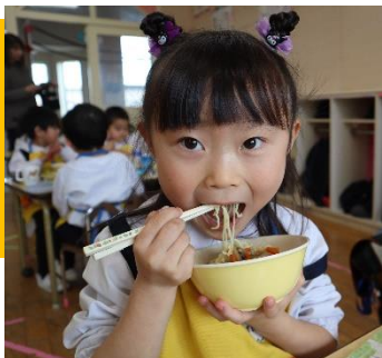
ヤーコンって何？ これだよ えー初めて食べた