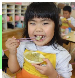
まつぐみさんの おいしい顔♡ さつま芋は ほくほく ヤーコンは しゃきしゃきして おいしい♡