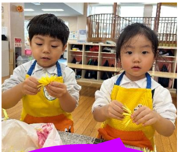
このお花どうやって 食べるの??