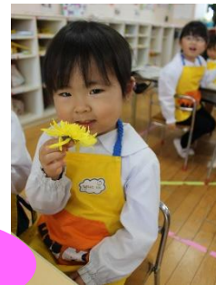
みて～ パラパラになったよ